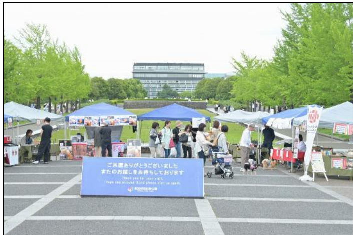
【ひめくりたちかわセレクション】 1日平均売上5~7万円

市内大型イベントや国営昭和記念公園のハイシーズンなどでの 臨時テント出店のチャンスあり【優先枠】