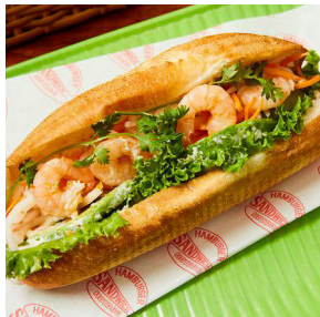
パインミー★サンドイッチ