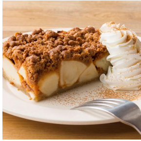
Adam's awesome PIE