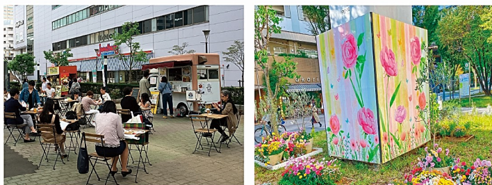
過去の花装飾とオープンカフェの様子

立川商工会議所の提唱する「まち・こころ 花めかそう」の事業で、年間を通じて「花」をテーマにしたイベントを展開しています。このイベントはサンサンロードを起点としたにぎわいの創出と地域振興を目的に行われています。通り掛かった方にちょっと寄っていただけるような、ほっとする空間を目指します。また、国営昭和記念公園では、年間を通じて四季折々のお花に関するイベントを開催中ですので、併せて花めく立川をお楽しみください。